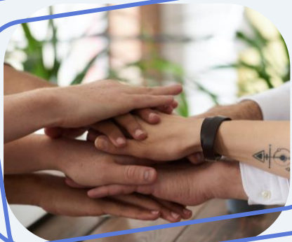
Командная работа и профессионализм