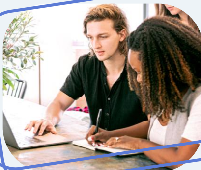
Забота о сотрудниках и клиентах